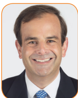
Dr. Gerhard Pfister

Conseiller national, président Neue Helvetische Bank