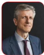
Darius Semaška Litauischer Botschafter in der Schweiz